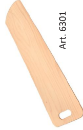
Tabla de haya multicapa para enhornar la pizza