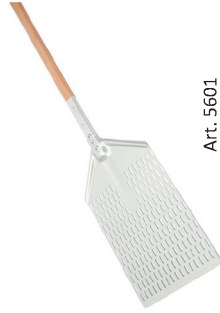
Pala "Fuxion" de aluminio para "Pinsa Romana"