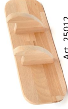
Colgador de palas de pared de haya lamelar