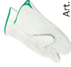
Guantes térmicos Temp. 300 C°