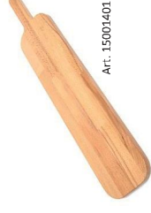
Tableta de haya lamelar con empuñadura para servir "Crostinos"