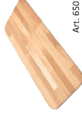
Tabla de haya lamelar para servir la pizza