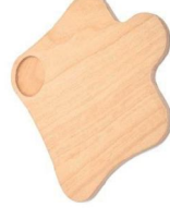
Picador "Nube" de haya multicapa con espacio para lata