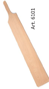
Estaca de haya evaporada