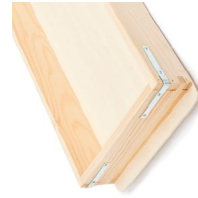
Caja de fermentación de abeto