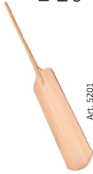
Pala de haya evaporada para pizza con mango