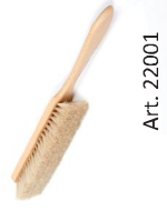
Cepillo para banco (crin blanco)