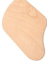
Pequeña tabla perfilada de haya multicapa para servir un pedazo de pizza