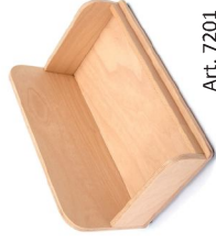
"Apoyapalas" de suelo de haya multicapa