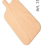
Tableta de haya multicapa con empuñadura para servir la "Pinsa Romana"