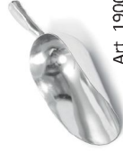
Pala de aluminio para hacer porciones de harina