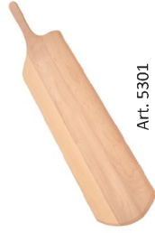
Pala de haya evaporada para pizza con empuñadura