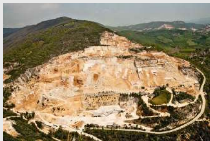
Bacino marmifero "Botticino Classico"

Botticino è ricco di risorse economiche industriali-artigianali ed agricole. E' rinomato in tutto il mondo per il suo marmo, per le aziende meccano-tessili e per il suo pregiato vino.