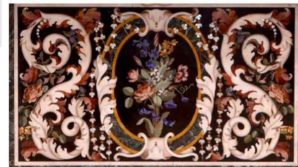
palio lavorato a commesso (XVIII sec.) Altare maggiore Basilica Botticino S.