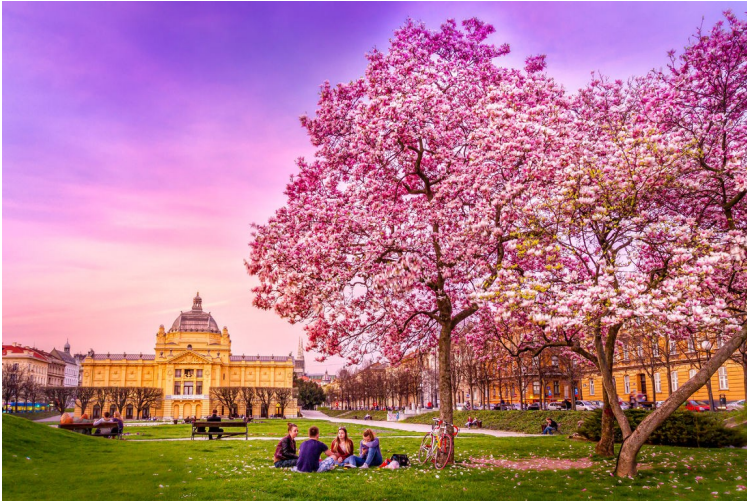
Parco Zrinjevac, TZ Zagreb

separava le due città corrispondeva al sito dell'odierna via Tkalčićeva , dove all'epoca scorreva un torrente .