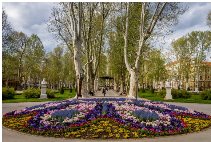
Parco Zrinjevac

Città in breve: La città di Zagabria si trova al centro della Croazia. Si estende sulle pendici meridionali del monte Medvednica e sulle rive del fiume Sava. La valuta ufficiale è la kuna croata. (10 euro=74 kn). Zagabria ha un clima continentale temperato, che varia nelle quattro stagioni. I mesi estivi sono caratterizzati principalmente dal clima caldo e asciutto, e le temperature medie variano da 20 a 25 °C, mentre i mesi invernali sono piuttosto freddi con temperature medie comprese tra 1 e 5 °C.