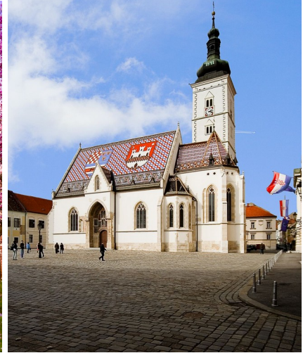
T. Sklopan, Chiesa di S. Marco

#Zagabria, la città Rubacuori. Passeggiando per le vie di Zagabria, visitandone i magnifici monumenti, scoprendo le tante collezioni artistiche o semplicemente stando seduti in uno dei numerosi caffè, perdendosi tra le vie e i parchi, parlando con la gente, il turista se ne innamorerà prima vista. Ma cosa la rende così speciale?