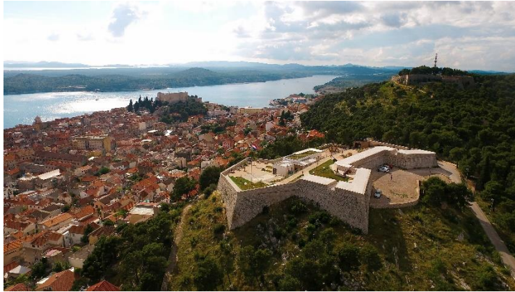
Fortezza Barone

La fortezza Barone costruita subito dopo la fortezza di San Giovanni, prima dell'arrivo dell'esercito ottomano nel XVII secolo. Questo avvenimento oggi può essere rivissuto tramite l'aiuto della tecnologia virtuale che dà vita a personaggi, suoni e scene dell'epoca. Edificata per ordine del comandante della difesa di Šibenik il barone Cristoph Martin von Degenfeld del quale porta il nome.