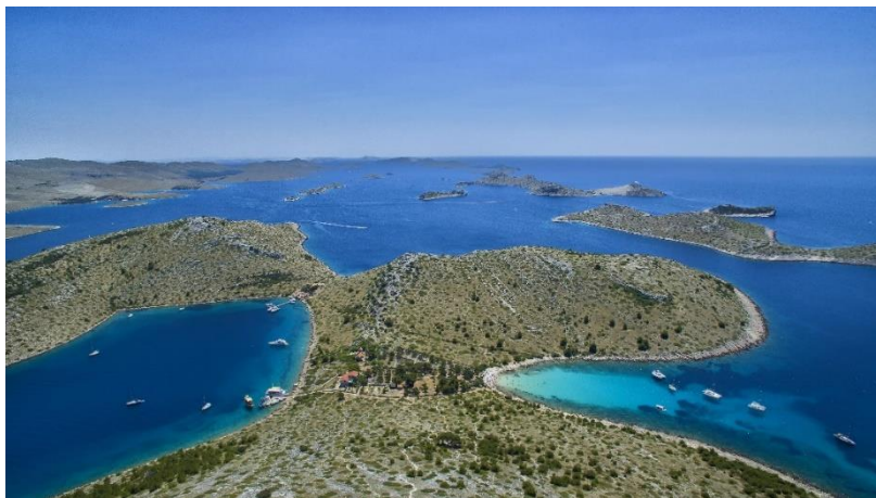
Parco nazionale isole Kornati

Basta imbarcarsi dalle cittadine vicino a Šibenik per esplorare il Parco Nazionale delle isole Kornati . Nel 1980 è stato proclamato parco nazionale grazie alla straordinaria bellezza, alla particolare geomorfologia, alla costa frastagliata e al ricco ecosistema marino. Questo ecosistema insulare è il più frastagliato dell'Adriatico e comprende 89 isole, isolotti e scogli. Grazie alla natura selvaggia incontaminata e alla bellezza straordinaria, attira sempre molti turisti contribuendo allo sviluppo del turismo escursionistico, sportivo e nautico.