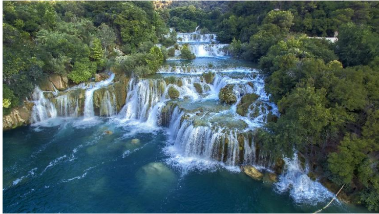
Parco nazionale Krka

Basta imbarcarsi dalle cittadine vicino a Šibenik per esplorare il Parco Nazionale delle isole Kornati . Nel 1980 è stato proclamato parco nazionale grazie alla straordinaria bellezza, alla particolare geomorfologia, alla costa frastagliata e al ricco ecosistema marino. Questo ecosistema insulare è il più frastagliato dell'Adriatico e comprende 89 isole, isolotti e scogli. Grazie alla natura selvaggia incontaminata e alla bellezza straordinaria, attira sempre molti turisti contribuendo allo sviluppo del turismo escursionistico, sportivo e nautico.