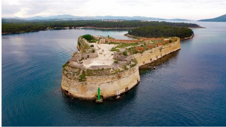
Fortezza di San Nicola (Sv. Nikola)