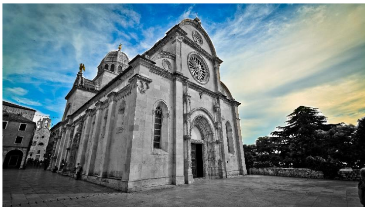
Cattedrale di San Giacomo (Sv. Jakov)

La cattedrale di San Giacomo (sv. Jakov) è una delle costruzioni più importanti e più belle realizzate in Croazia, completamente in pietra, costruita tra il XV e il XVI secolo. Tra i nomi più importanti per la sua realizzazione citiamo Juraj Dalmatinac e Nikola Firentinac. L'opera fu iniziata in stile gotico per poi finire in stile rinascimentale. Nel 2000 è stata inserita nella lista del Patrimonio mondiale UNESCO, oggi la sua cupola è un simbolo per la città di Šibenik.