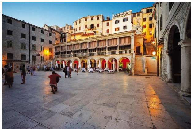
Piazza della Repubblica di Croazia – Ente del turismo della città di Šibenik

Oltre ai numerosi edifici religiosi, i palazzi, le case dei nobili, i portali e le arcate, il centro storico si distingue per la bellezza della sua piazza centrale, Piazza della Repubblica di Croazia , che nel Medioevo, si chiamava “Plathea Comunis” ed era lo spazio pubblico più importante del comune di Šibenik. Per secoli è stata il fulcro della vita sociale pubblica, circondata dalla cattedrale di San Giacomo, la Grande Loggia (rinominata recentemente Municipio) e Piccola Loggia (la loggia della guardia cittadina). Nelle immediate vicinanze della piazza principale si trova anche il Palazzo Ducale, sede dell'autorità cittadina ai tempi dell'amministrazione veneziana.