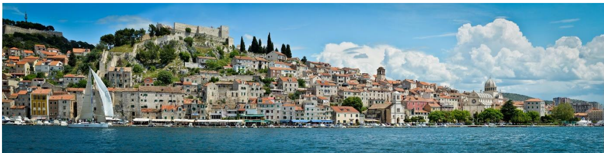
Panorama di Šibenik

Sulla fortezza di San Giovanni è stata girata la scena dei combattimenti della città di 'Meereen'. Questo è il luogo dove il personaggio Jorah sconfigge numerosi combattenti, mentre Daenerys osserva la battaglia dalla tribuna.