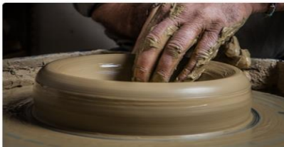
LABORATORIO DI TERRECOTTE A FRATTE ROSA