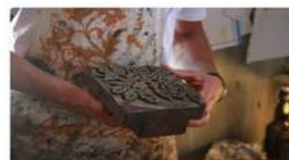
REALIZZARE UNA STAMPA SU TESSUTO CON COLORE RUGGINE