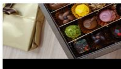
I CINQUE SENSI DEL CIOCCOLATO