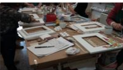
LABORATORIO DI SHABBY CHIC