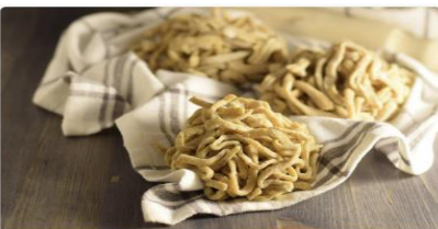
CORSO DI CUCINA A FRATTE ROSA: I PIATTI DELLA TRADIZIONE 65,00 €