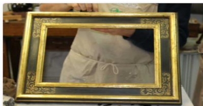
LABORATORIO DI DORATURA A FOGLIA 99,00 €