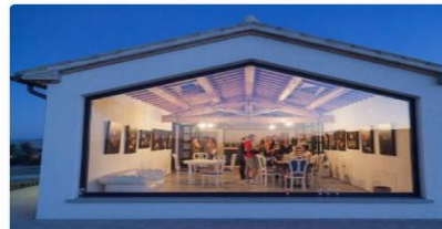
VISITA GUIDATA IN VIGNA E CANTINA + DEGUSTAZIONE GUIDATA FINO A 10 VINI