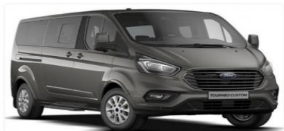
TRANSFER BOLOGNA - PESARO o VICEVERSA